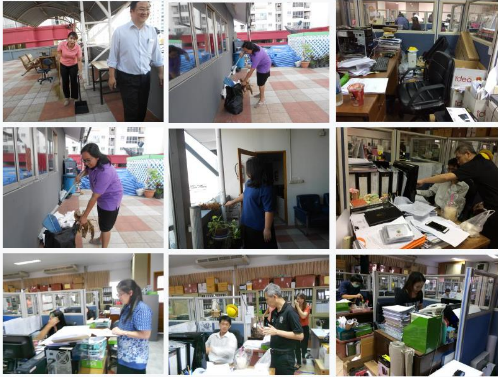
สภาพแวดล้อมของพื้นที่ :